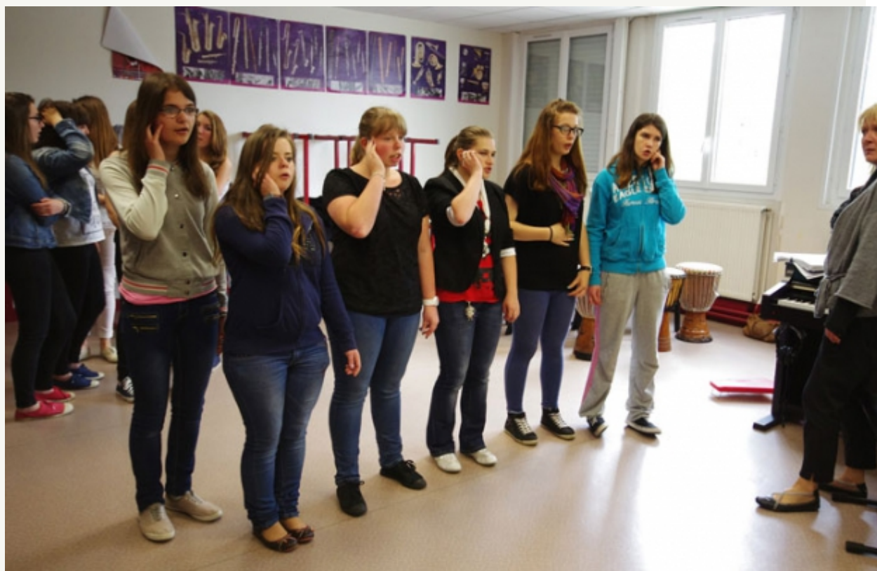
Brothers in Arts.

Les 19 et 21 septembre à Hédé-Bazouges : Festival Jazz aux Ecluses Concerts « Jazz for freedom » . Coup de projecteur sur le projet « Brothers in Arts ».